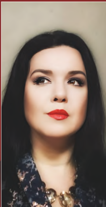
Irina Iordăchescu soprană